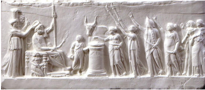
Abb. 5: Ausschnitt von der sog. Homerapotheose (SH 1696)

zweifelloes Recht, wenn er sagte, dass «von Anbeginn alle nach dem Homeros gelernt haben». Man feierte ihn bis ans Ende der Antike und errichtete ihm allerorten auf öffentlichen Plätzen und Heiligtümern Ehrenstatuen.