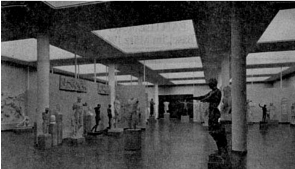
Abbildung 1: Blick in die neue Skulpturhalle an der Mittleren Strasse.

Basel bereitet sein Antikenmuseum vor. Es soll eine Stätte der Kunst werden, wie sie in weitem Umkreis nicht gefunden wird, wo Originalwerke eine umfassende Anschauung der Kunst der Antike bieten sollen. Direkt und klar soll die Ansprache der Kunstwerke sein, ohne Vermittlung von Lehre und Wort. Die Wirkung dieser Neugründung wird durch die Qualität der Bestände und durch die Art und Weise ihrer Aufstellung bestimmt werden. Was bisher gesammelt wurde, der Zuwachs der letzten Zeit, die zu erwartenden Leihgaben aus Privatbesitz, schliesslich die Pläne der Ausgestaltung des Berri-Hauses am St. Albangraben und der Neubau des Annexes, all das berechtigt zu grossen Hoffnungen. Eines allerdings wird das Basler Antikenmuseum nie nachholen können: zum Aufbau einer Skulpturensammlung von hohem Rang kommen wir spät, vielleicht zu spät.