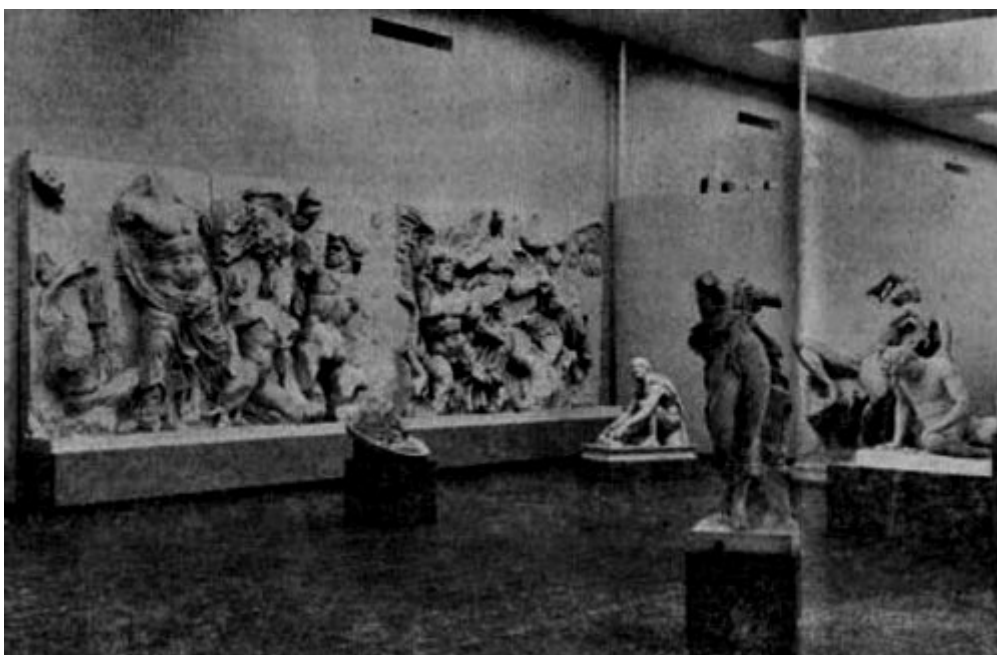
Abbildung 2: Blick in die neue Skulpturhalle an der Mittleren Strasse.

Und heute? Nutzen und Notwendigkeit einer Abgusssammlung antiker Skulpturen für Forschung und Lehre können nicht genug geschätzt werden. An Gipsen kann der Archäologe verstreute Teile einer Plastik zusammenführen. Adolf Furtwängler setzte in Gips einen berühmten Frauenkopf von Bologna einer Statue der Pallas Athene in Dresden auf, die einen nicht zugehörigen Kopf besass: er fügte die „Athena Lemnia“ zusammen, und es erstand von neuem – in Gips – das einzige Götterbild des Meisters Phidias, das einigermassen sicher und in Originalgrösse überliefert ist. Humpfrey Payne bewies mit Abgüssen, dass Oberkörper und Kopf einer archaischen Frauenfigur in Lyon auf einen Unterkörper auf der Akropolis, und dass der sog. „Rampin'sche Jünglingskopf“ im Louvre auf einen Akropolisreiter passten; er liess so zwei archaische Meisterwerke wiedererstehen. Der Eros vom Parthenon Ostfries, durch Lord Elgin in Gips abgeformt, ist im Original verloren. Nur an Abgüssen kann man plastische Experimente machen, Köpfe vertauschen, Gruppen zusammenstellen, wie etwa die einleuchtende Rekonstruktion der Tyrannenmördergruppe durch Karl Schefold in Basel.