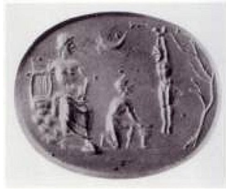
Abb. 3: Römisches Karneol in Privatbesitz.

Der Marsyas-Mythos ist von antiken Künstlern vielfach dargestellt worden. Den berühmtesten Vorläufer der hellenistischen Gruppe stellt die um 450 v. Chr. vom attischen Bildhauer Myron geschaffene Athena-Marsyas-Gruppe dar, die ebenfalls in einzelnen römischen Kopien überliefert ist (siehe SH 102, 917). Myron brachte in seiner Gruppe eine frühere und entscheidende Episode aus dem Marsyas-Mythos zur Darstellung: Die Göttin Athena, die eben ihre Flöten weggeworfen hat, warnt Marsyas, der verzückt auf die Flöten blickt, davor, die Instrumente zu ergreifen; Marsyas konnte der Versuchung jedoch nicht widerstehen, womit das Verhängnis seinen Lauf nehmen sollte.