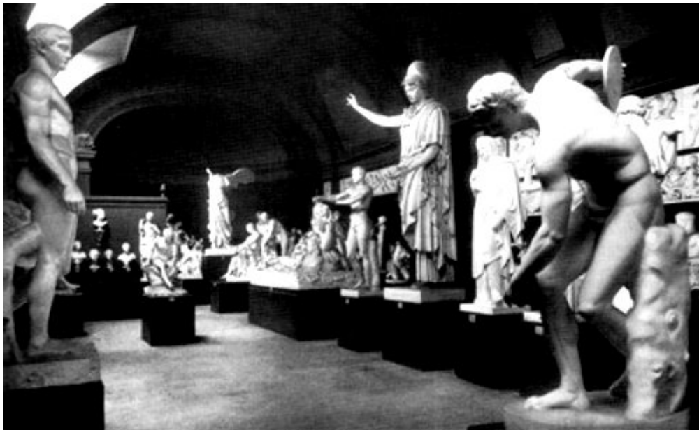
Abbildung 3: Aufstellung der Abgüsse in der alten Skulpturhalle.

dort seit Jahren regelmässig durchgeführt. Auch der Basler Freizeitaktion und den anderen ähnlichen Verbänden stand seit 1941 die Halle immer zur Verfügung.