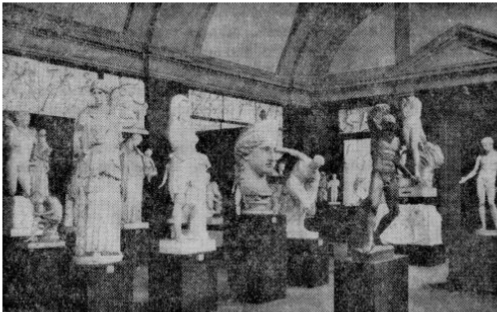
Abbildung 1: Aufstellung der Abgüsse in der alten Skulpturhalle.

Die Anfänge der Basler Abgussammlung gehen in die dreissiger Jahre des letzten Jahrhunderts zurück. Nach dem Beispiel des 1825 begründeten „Akademischen Kunstmuseums“ in Bonn begann man in jener Zeit fast an allen Universitäten des deutschen Typus die verstreuten plastischen Vorbilder der Antike für die Studierenden und kunstfreudigen Laien in Abgüssen zusammenzustellen. In Basel wurde diese Sammlung zunächst im Museumsbau an der Augustinergasse (1849) mit der Gemäldesammlung, der Naturhistorischen Sammlung und der Universitätsbibliothek zusammen aufbewahrt und als ein integrierender Bestandteil unseres Kulturgutes empfunden. Schon bald wurde der zur Verfügung stehende Raum zu klein. Mit Hilfe des Staates, des Kunstvereines, der Freiwilligen Akademischen Gesellschaft, des Freiwilligen Museumsvereins und vor allem durch die grosszügige Spende von Herrn Oberst Johann Jakob Merian-Iselin wurde an der Klostergasse hinter der Kunsthalle ein eigenes Heim geschaffen und am 22. Oktober 1887 als neue Skulpturhalle eingeweiht. Hier erweiterte man auch die Ziele der Sammlung, indem man auch die Werke des Mittelalters und der Renaissance einschloss. Diese Skulpturhalle wurde bald innerhalb der Schweiz führend und auch im Ausland beachtet.