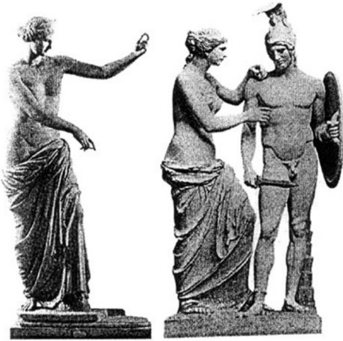
Abb. 2: „Venus von Capua“ in Neapel (links) und eine eher phantastische Gipsrekonstruktion in Kombination mit dem „Ares Borghese“, einem Werk um 420 v. Chr.