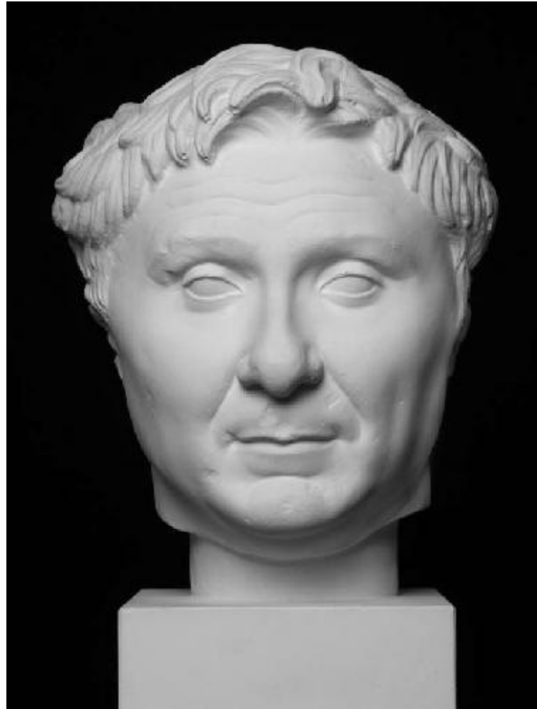
Abb. 1: Kopf in Kopenhagen

Der Politiker und Feldherr Gnaeus Pompeius, der später seinen Beinamen Magnus erhielt, ist als Sohn des Gnaeus Pompeius Strabo am 29. September 106 v.Chr. in Pianum geboren. Seine Laufbahn begann bereits früh während den Bundesgenossenkriegen (91-89/82 v. Chr.) im Heer seines Vaters. Er stellte sich auf die Seite von Sulla, heiratete dessen Stieftochter und eroberte in seinem Auftrag Sizilien zurück. Spätestens 79 v.Chr. bewilligte ihm Sulla einen Triumphzug. Voraussetzungen für die Gewährung eines solchen Triumphzuges, waren der Sieg in einem rechtmässigen Krieg (wobei Sklaven- und Bürgerkriege nicht dazuzählten), die militärische Befehlsgewalt, eine bestimmte Anzahl getöteter Feinde sowie vor allem die Bewilligung seitens des Senats. Konsul wurde er erst nach seinem zweiten Triumphzug im Jahre 70 v.Chr., was ungewöhnlich ist, da politische Ämter eigentlich die Voraussetzung für eine militärische Laufbahn und einen Triumph waren und nicht umgekehrt.