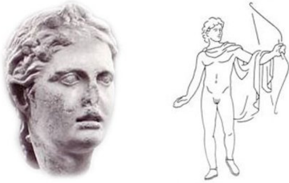
Abb. 2: Der „Steinhäusersche Kopf“ im Antikenmuseum Basel und eine Rekonstruktionszeichnung mit Bogen.

Skulpturhalle vor rund 25 Jahren die linke Hand durch eine Kopie nach einem römischen Abguss vom griechischen Bronzeoriginal, welche zusammen mit anderen antiken Gipsfragmenten 1954 in Baiae bei Neapel ausgegraben worden war, ersetzt.