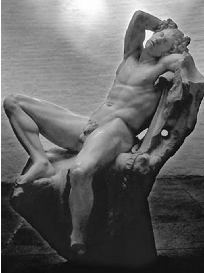
Abb.2: Der „Barberinische Faun“ in der Glyptothek München.

da dessen Ergänzung als zu aufdringlich und bar der Natürlichkeit einer griechischen Plastik empfunden wurde. (Am späteren Abguss von Silvano Bertolin sind diese Pacetti-Ergänzungen alle entfernt worden.)