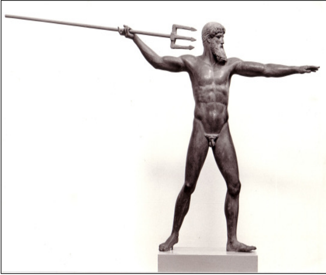
Abb. 2: Ergänzungsvorschlag der Skulpturhalle: Der Gott als Poseidon mit Dreizack.

Kinn weisen in die Richtung, in die er werfen wird. Der kleine Mund ist eingerahmt von einem Vollbart aus langen dichten und strähnigen Haaren. Den Kopf umspannt ein kunstvoll geflochtener Zopf; unter ihm